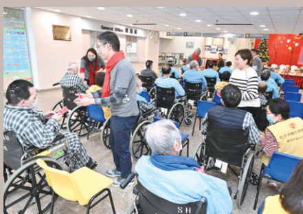
活動結束後一眾義工為院友送上祝福及新年禮物