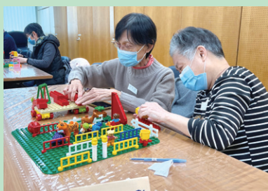
從遊戲中學習團隊的合作

威爾斯親王醫院健康資源中心於2月及3月舉辦了兩節的病友組織義工訓練。第一節以得寶遊戲箱 (DUPLO Play and Learn) 為媒介，透過遊戲方式讓參加者體驗團隊合作的重要，以加強服務時的協作能力。第二節則邀請臨床心理學家以短講和小組討論形式令參加者掌握探訪時的重要溝通技巧。