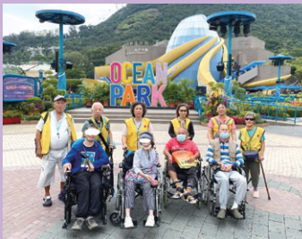
一場嚟到，梗係要嚟返張大合照先啦

秋高氣爽，最適合戶外活動，因此沙田慈氏護養院「心靈綠洲」家屬小組誠邀本院院友一起暢遊海洋公園，共渡歡樂的一日。