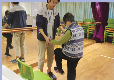
物理治療師正評估長者的平衡力