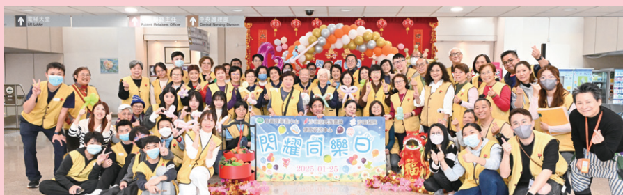
當日有超過 50 位義工協助帶領院友到大堂玩遊戲