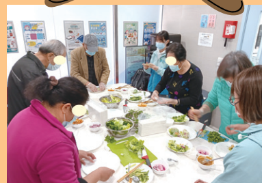
營養師講解小食的營養價值