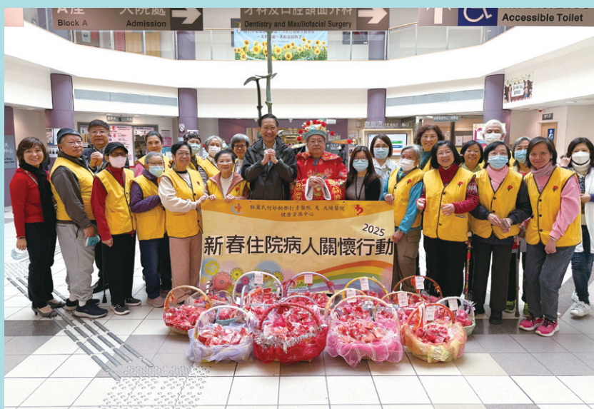
出發探訪前，冼醫生與義工合照及為他們打氣