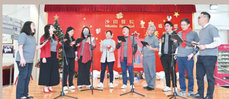
在旋律的交織中，義工和院友們共同編織出一段美好的時光

健康資源中心誠邀義工團體 - The Pelicans 在 1 月 4 日於本院一樓大堂舉辦音樂表演活動「金曲樂韻獻關懷」。當日義工以無伴奏合唱的形式，演繹十多首長者耳熟能詳的金曲，為現場觀眾送上了一場溫馨感人的音樂饗宴。