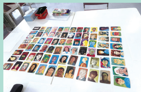
透過使用圖卡，讓參加者抒發對「失去親人」的想法和感受

由三月起，白普理寧養中心每個月都會舉辦「同一天空下」的小組，為三十歲以上的喪親者而設，希望能讓失去摯親的家屬們在這段傷痛的日子裏與其他同路人互相分享、彼此支持、逐步適應喪親後的生活。