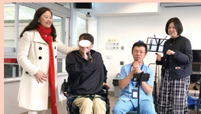
慈氏院友都唔執輸，都同大家高歌一曲，仲誠邀沃醫生合唱