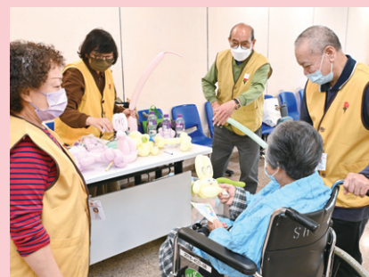
活動當日，場地洋溢著歡樂的氛圍，義工及院友積極投入各式趣味攤位遊戲

健康資源中心聯同香港神託會創耆坊（馬鞍山／沙田）、基督教聖約教會耀安長者鄰舍中心及聖公會馬鞍山（南）青少年綜合服務中心於 1 月 25 日在本院一樓大堂舉辦攤位遊戲活動 - 閃耀同樂日，藉此推廣社區共融及精神健康的訊息。