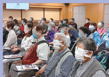
老年人精神健康講座