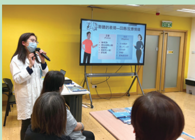
聆聽是必需學習的探訪技巧