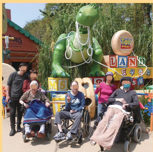
護養科病人及其家屬亦一同外出，舒展身心

2025 年 3 月 22 日那打素醫院及大埔醫院舉行「開心暢遊迪士尼」活動，病友小組及家屬共 123 人一同到迪士尼遊玩。