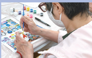
大家都非常投入活動