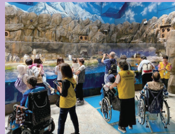
雖然企鵝係好得意，但呢度真係好凍啊