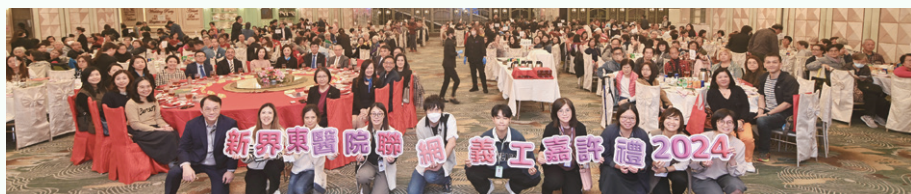
是次活動筵開 51 席，場面熱鬧