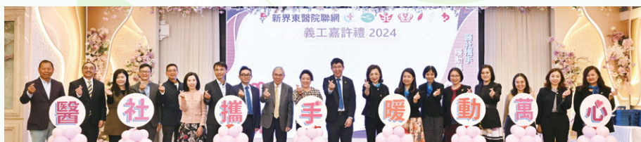
今年大會口號 - 「醫社攜手、暖動萬心」

由新界東醫院聯網（聯網）健康資源中心舉辦「義工嘉許典禮 2024」已於 12 月 12 日順利舉行！是次「義工嘉許典禮」共有約 600 位義工出席，筵開 51 席。嘉賓陣容鼎盛：包括聯網總監 鍾健禮醫生、服務總監（社區及基層健康）梁堃華醫生、社會福利署福利專員、聯網各醫院管治委員會主席、社區關係委員會主席、及行政總監等等。當晚頒發個人義工獎項 200 個，機構義工獎 92 個。今年有 41 位義工獲得 20 年或以上義工服務獎，義工們對服務的熱誠和堅持實在令人敬佩！除頒獎外，少不了令全場熱血沸騰的醒獅表演和抽獎環節，亦有悅耳動聽的口琴演奏及唱歌表演，義工和嘉賓都樂在其中！