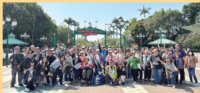
那打素病友小組會員一同在迪士尼門前合照