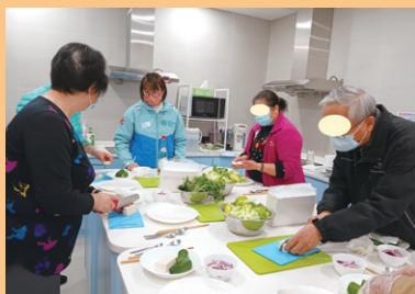
營養師教導病友製作健康越式春卷

活動與大埔地區康健站合辦，由營養師教導病友製作健康小食，希望病友藉此管理自己的健康。