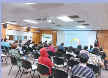
中年人精神健康講座

本中心與大埔地區康健站合辦了共3個精神健康講座，包括青少年，中年人及老年人精神健康講座，提倡大眾關注情緒及精神健康問題。