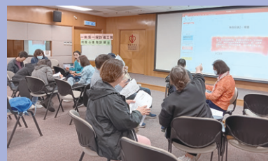
義工分組討論，練習所學